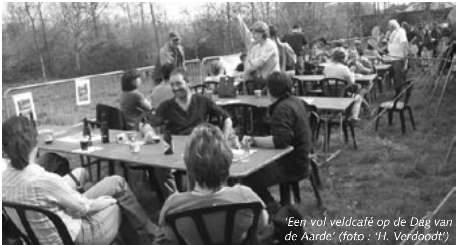
'Een vol veldcafé op de Dag van de Aarde'

Meisese leden die graag onze digitale Natuur.Meise-Flits ontvangen kunnen zich nog steeds aanmelden via info@natuurpunt-meise.be .