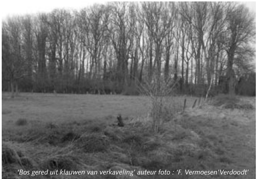
'Bos gered uit klauwen van verkaveling'

Er is ook slecht nieuws, want groot was onze verbazing toen we het resultaat te lezen kregen van het beroep dat een eigenaar had ingediend bij de Bestendige Deputatie tegen de weigering van een vergunning voor het dempen van een