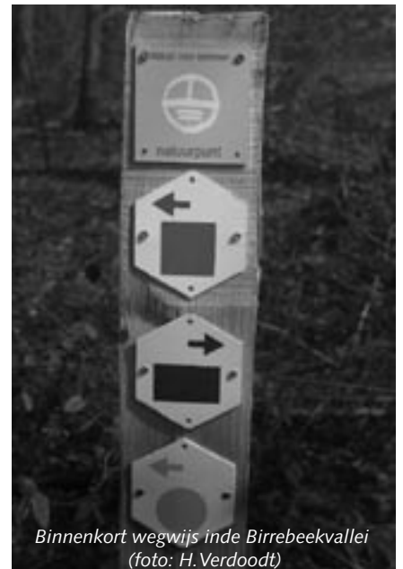
Binnenkort wegwijzende in de Birrebeekvallei

Het natuurgebied heeft de laatste maanden enkele belangrijke ingrepen gekend. Zo werd een laatste voetgangersbrugje over de Birrebeek geslagen, en ook een brede veebrug over de Heidebeek. De drinkpoel werd gegraven, de omheiningen verstevigd, de weidepoorten en een veekraal geplaatst. Het zijn de laatste grote werken in het kader van de door de overheid betaalde eenmalige inrichtingswerken. Is het natuurgebied nu 'af'? Neen, natuurlijk niet ... we blijven er verder puzzelen aan meer natuur en op termijn nog een extra wandelpad. Deze zomer zijn we trouwens nog zoet met het project van